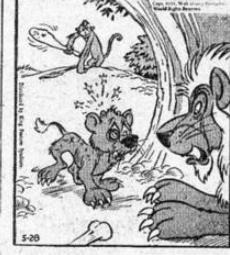
—Papá, ¿cuántos años me faltan para ser Rey de la Selva?