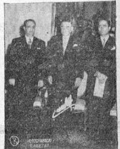
Momentos en que el nuevo Ministro de Cuba presentaba credenciales ante el señor Presidente de la República y el Canciller Echandi

El Ministro de Cuba presenta credenciales