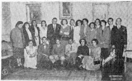
Muestra la foto al Presidente de la República rodeado del Ballet Guatemala durante la visita de cortesía que éste le hiciera.